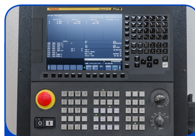
PAINEL OPERACIONAL FANUC