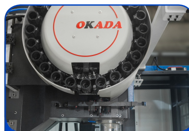
MAGAZINE DE FERRAMENTAS